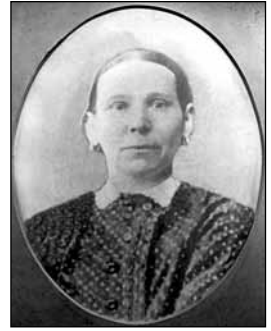
(Прародители семьи Сорокиных).