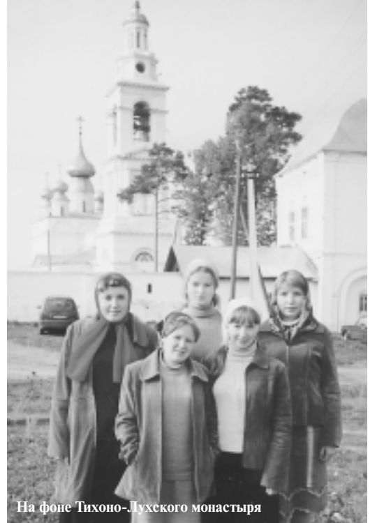
На фоне Тихоно-Лухского монастыря