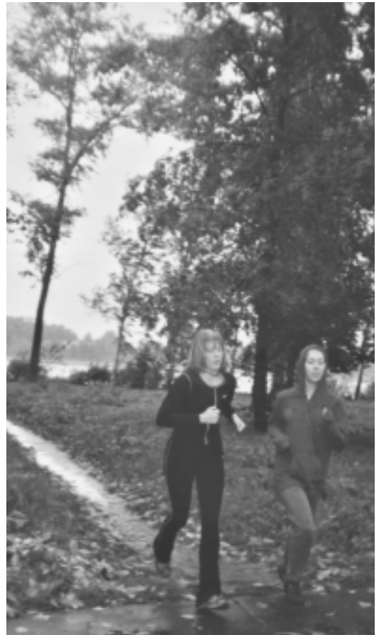
Дождь спорту не помеха

Всего в кроссе участвовали 78 юношей и 75 девушек. Лидерами среди них