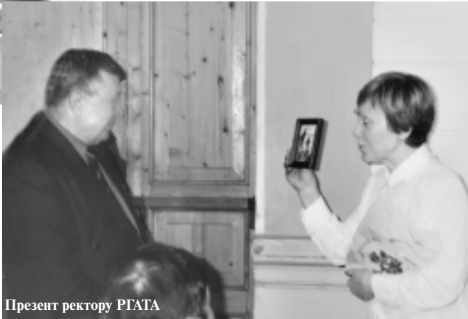
Презент ректору РГАТА

17.00. В студенческой столовой - посиделки с нижегородцами. Ужин за длинным столом, разговоры, тосты (с компотом), песни, гитара, дискотека, фото на память, обмен адресами. Грусть... Их автобус отъезжает в сумерках, друзья прилипли к заднему стеклу, машут руками, а мы машем им. До свидания!