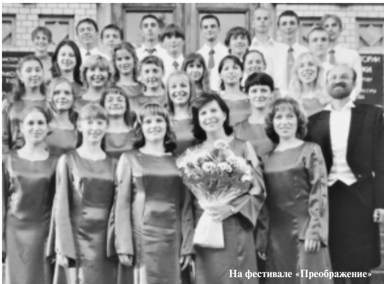
На фестивале «Преображение»